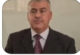
رئيس مكتب الدراسات العليا أ. د. النعمي العالم